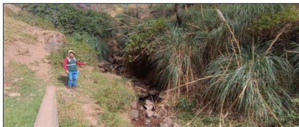
FIGURA N°01: Tramo de la quebrada, que muestra vegetación densa, un talud inestable y parte de una estructura de concreto en la margen.