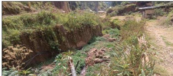
FIGURA N°02: Vista de la quebrada con una margen concreto parcialmente cubierta por vegetación, lo que podría generar una obstrucción y alterar el flujo.