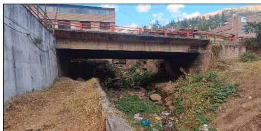
FIGURA N°03: Cauce de la quebrada pasando por debajo de un puente vehicular, con una evidente acumulación de residuos y maleza, lo que reduce la capacidad de desfogue del agua.